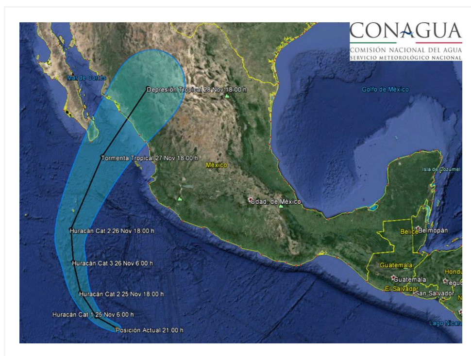
Imagen de trayectoria del huracán categoría 1 "SANDRA"